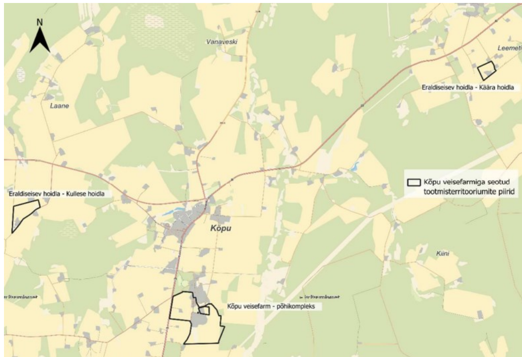
Joonis 1. Kõpu veisefarmiga seotud tootmisterritooriumite asukohad (aluskaart: Maa- ja Ruumiamet). Allikas: KMH programm.

Kavandatava tegevuse eesmärgiks on Kõpu veisefarmi laiendamine Viljandi maakonnas Põhja-Sakala vallas Supsi külas 1 ja Viljandi vallas Leemeti külas 2 . Uueks ülesseatud tootmisvõimsuseks taotletakse 1450 piimalehma, 1009 noorveist, 500 vasikat. Lisanduvad uued heiteallikad (3 laudahoonet, vasikalauda laiendus ja 7 vedelsõnniku/kääritusjäägi rõngasmahutit).